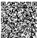
障害者雇用促進法の概要

●下記の厚生労働省ホームページでもご覧ください（QRコードから各ページにジャンプします）