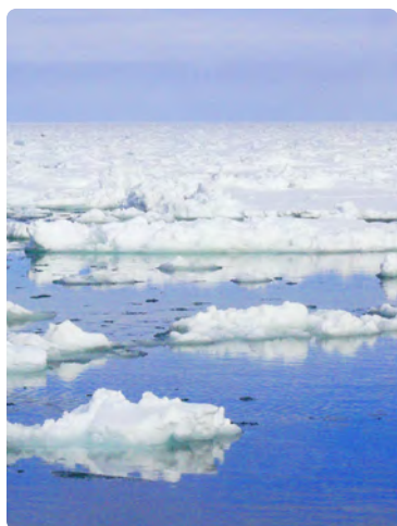
1月になると、オホーツク海の流氷を見に世界中から多くの方が訪れます。幻想的な時期はもうすぐです。