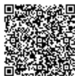
障害者差別禁止・合理的 配慮に関する Q&A (PDF)